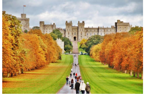
Castell de Windsor