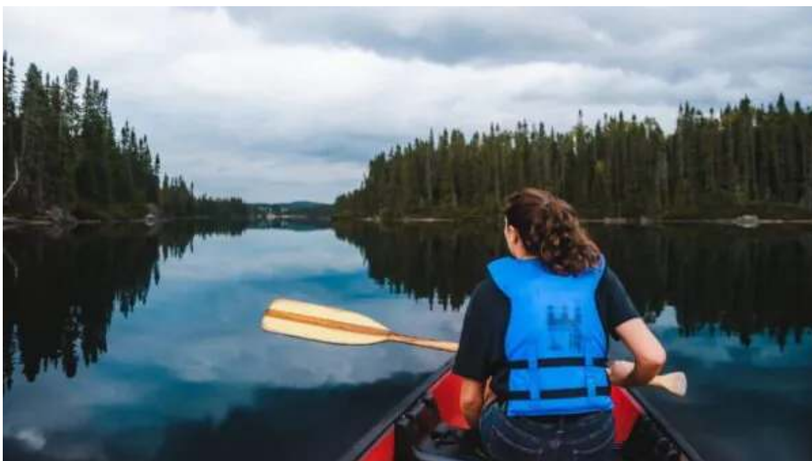
Activitats a Seigneurie du Triton