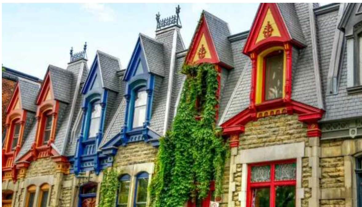
Cases Victorianes a Montreal

Barreja de la vella Europa i la nova Amèrica, Montreal és una metròpoli molt dinàmica i amb una gran vida cultural. Comença el dia visitant el nucli antic de la ciutat, on destaquen els carrers i places històriques al voltant de la bella catedral de Notre Dame. Recorre el Port Vell, el barri llatí, l'animat centre de la ciutat o el complex olímpic. També pots aprofitar per explorar un dels fascinants museus de la ciutat, passejar pel mercat Jean-Talon, o fer una passejada pel Mont Royal. Nit a Montreal.