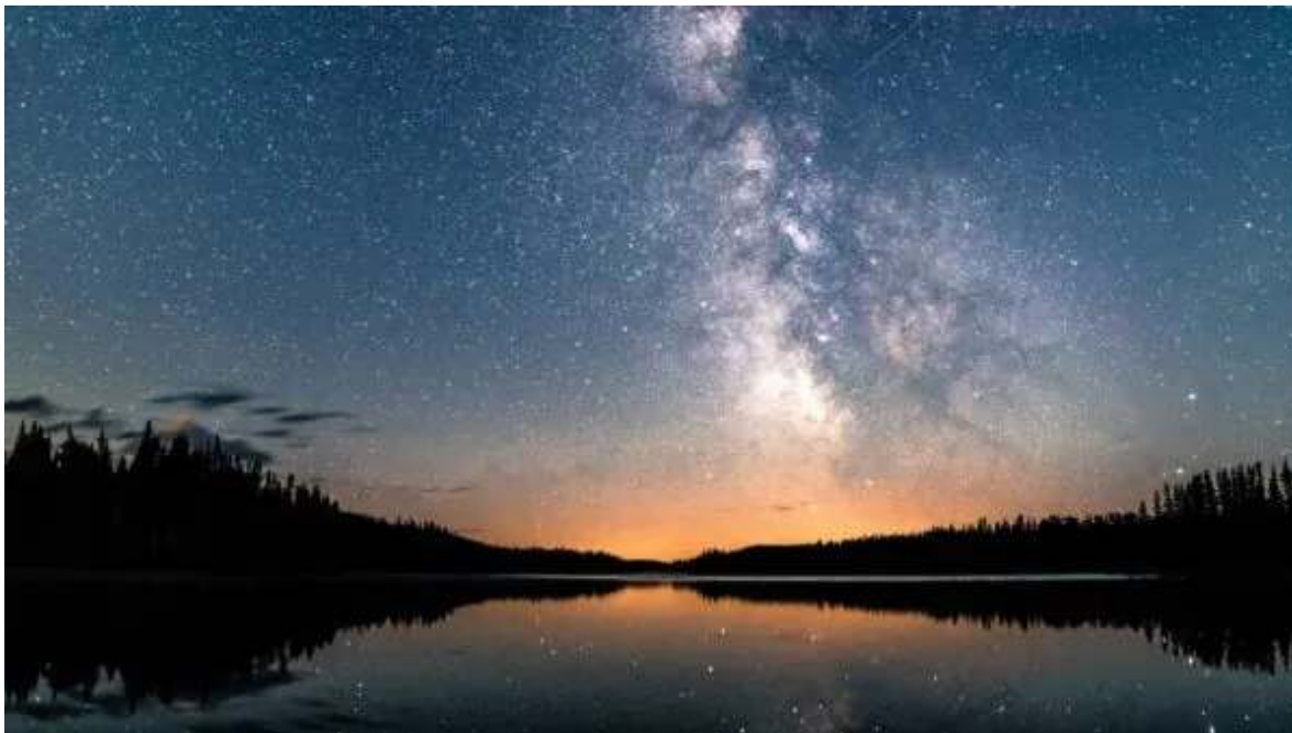
Nit estrellada

Surt al matí i submergeix-te al Quebec més rural, a la bonica regió de Mauricie. Gaudeix de la serenitat i la bellesa natural que ofereixen els seus boscos exuberants, llacs i rius, passeja per petits pobles rurals que reflecteixen l'estil de vida tranquil i tradicional de la zona, i descobreix veritables delícies de la seva gastronomia regional, mentre et dirigeixes al teu destinació per a les properes dues nits: el Seigneurie du Triton . És un lodge forestal que ofereix una experiència única en contacte amb la natura i activitats a l'aire lliure. Sopar i nit al Seigneurie du Triton.