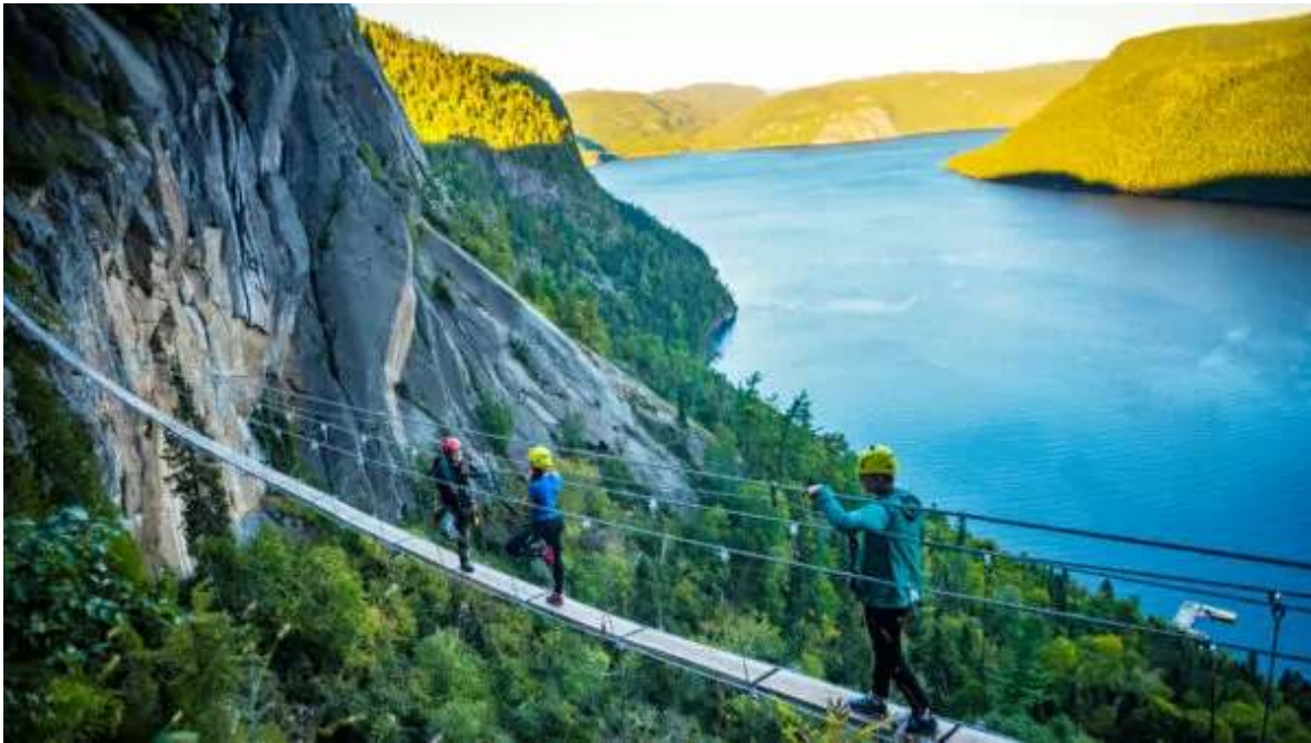
PN Fjord du Saguenay

Avui disposes de tot el dia per descobrir el Parc Nacional de Saguenay. El Fiord de Saguenay és un dels fiords més llargs i profunds del món. L'aigua freda i salada del riu Sant Llorenç es barreja amb l'aigua dolça i més càlida del Saguenay, creant un hàbitat ideal per a una vida marina sorprenentment diversa. Pots visitar el centre d'interpretació del parc, que ofereix informació detallada sobre la formació i la vida al fiord, i des d'allà fer alguna ruta de senderisme per gaudir dels impressionants paisatges, o si prefereixes una experiència més activa, pots optar pel caiac o les canoes, navegant al llarg de les tranquil·les aigües del fiord. Nit a la regió de Saguenay.