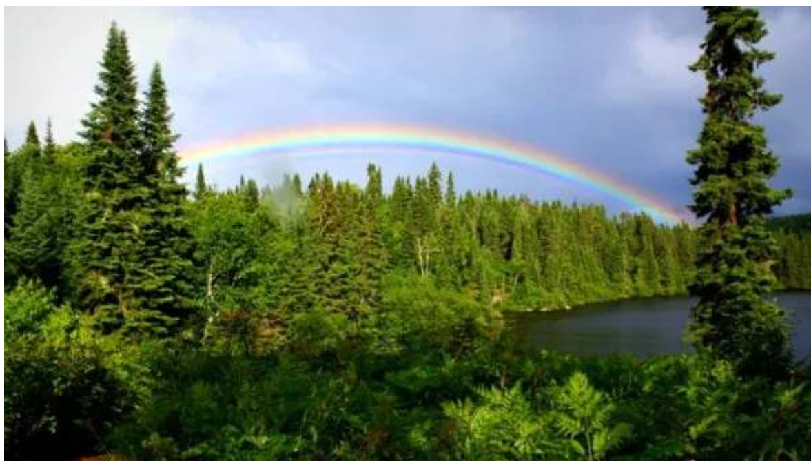
Llac Edouard

Esmorzar. Disposes fins després de dinar per continuar gaudint d'aquest meravellós lloc, de les seves activitats i de la natura més pura. Surt cap a primera hora de la tarda cap a Saint-Alexis-des-Monts, conegut per la serenitat dels seus paisatges i els seus llacs, on passaràs els dos últims dies del teu viatge. El recorregut us permetrà gaudir de la natura i les vistes escèniques de la regió de Mauricie. Sopar i nit al Pourvoirie du Lac Blanc o similar ( Lac-à-l'Eau-Claire o similar en opció «hotels Primera»), a la zona de Saint-Alexis-des-Monts.