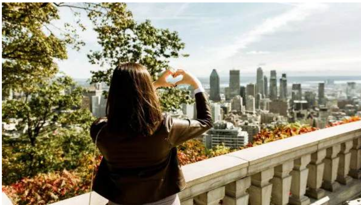
Vista de Montreal des de Mont Royal

Barreja de la vella Europa i la nova Amèrica, Montreal és una metròpoli molt dinàmica i amb una gran vida cultural. Comença el dia visitant el nucli antic de la ciutat, on destaquen els carrers i places històriques al voltant de la bella catedral de Notre Dame. Recorre el Port Vell, el barri Ilatí, l'animat centre de la ciutat o el complex olímpic. També pots aprofitar per explorar un dels fascinants museus de la ciutat, passejar pel mercat Jean-Talon, o fer una passejada pel Mont Royal.