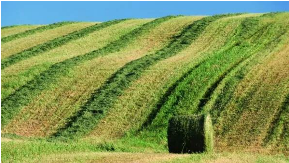
Camps de la regió de Témiscamingue

Surt de Rouyn-Noranda i dirigeix-te cap al sud, deixant enrere la regió d'Abitibi per endinsar-te a la regió de Témiscamingue. Al llarg del camí, notaràs un canvi significatiu al paisatge i la vegetació. Les denses coníferes donaran pas a un paisatge més verd, reconegut per les terres fèrtils i el bosc mixt. A prop de Ville-Marie, no et pots perdre el Lloc Històric Nacional del Fort-Témiscamingue/Obadjiwan, situat a la vora del bonic llac Témiscamingue, que commemora la història de la regió i el seu paper en el comerç i les relacions entre els pobles indígenes i els colonitzadors europeus. Nit a La Bannik o similar, a prop de Ville-Marie.