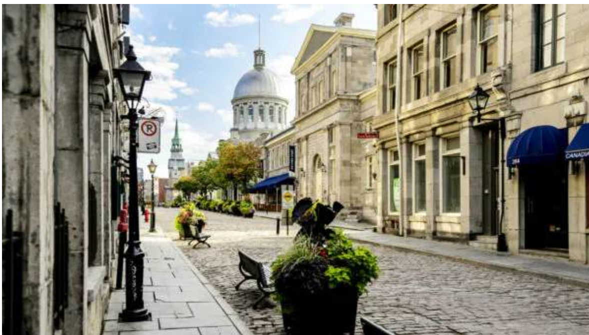
Old City, Montreal

Presentació al vostre aeroport d'origen a l'hora indicada per efectuar els tràmits de facturació del vol a Montreal. El vol és directe des de Madrid i des de Barcelona. Després de la facturació, embarcament i sortida del vol cap al Canadà. En arribar, recollida de l'equipatge, tràmits de