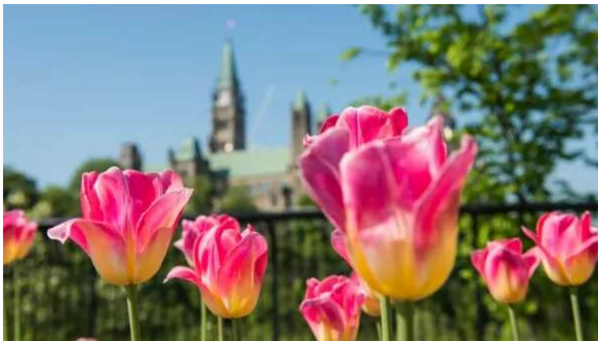
Vista al Parliament Hill

Dia complet per visitar Ottawa. Comença amb el recorregut pel turó del parlament per visitar els edificis de la capital federal i assistir al canvi de guàrdia. Després podeu recórrer el preciós Canal Rideau i els nombrosos parcs de la ciutat que envolten el riu. Si fa bo llogar bici és una gran manera de gaudir d'Ottawa, o també podeu fer un creuer pel riu. La ciutat presumeix de tenir els millors museus del país, com el Museu Canadenc de les Civilitzacions, un dels museus etnogràfics millors i més divertits de visitar de tot el món. Amb una arquitectura espectacular recull de manera molt amena tant la història del país com les diferents cultures i ètnies que el componen. Nit a Ottawa.