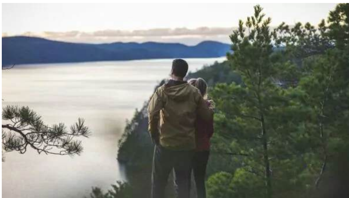
Parc Nacional d'Opémican

Dedica el matí a seguir visitant algunes de les joies locals de la regió, com la Maison du Frère-Moffet al cor de Ville-Marie, que narra els inicis de Témiscamingue com a nova terra de colonització a finals del segle XIX; o el TE Draper/Chantier Gédéon a Angliers, que reviu la història del flotatge de fusta a la regió. Et suggerim fer una parada per a un pícnic a l'impressionant Parc Nacional d'Opémican. Vorejat pels llacs Témiscamingue i Kipawa, el parc es caracteritza per la presència dominant de grans pins blancs i vermells, relleu accidentat i parets rocoses al llarg del llac Témiscamingue. Segueix la ruta 17 pel costat d'Ontario i vorejant el riu Outaouais, fins a arribar a la capital nacional. Nit al Lord Elgin Hotel o similar, a Otawwa.