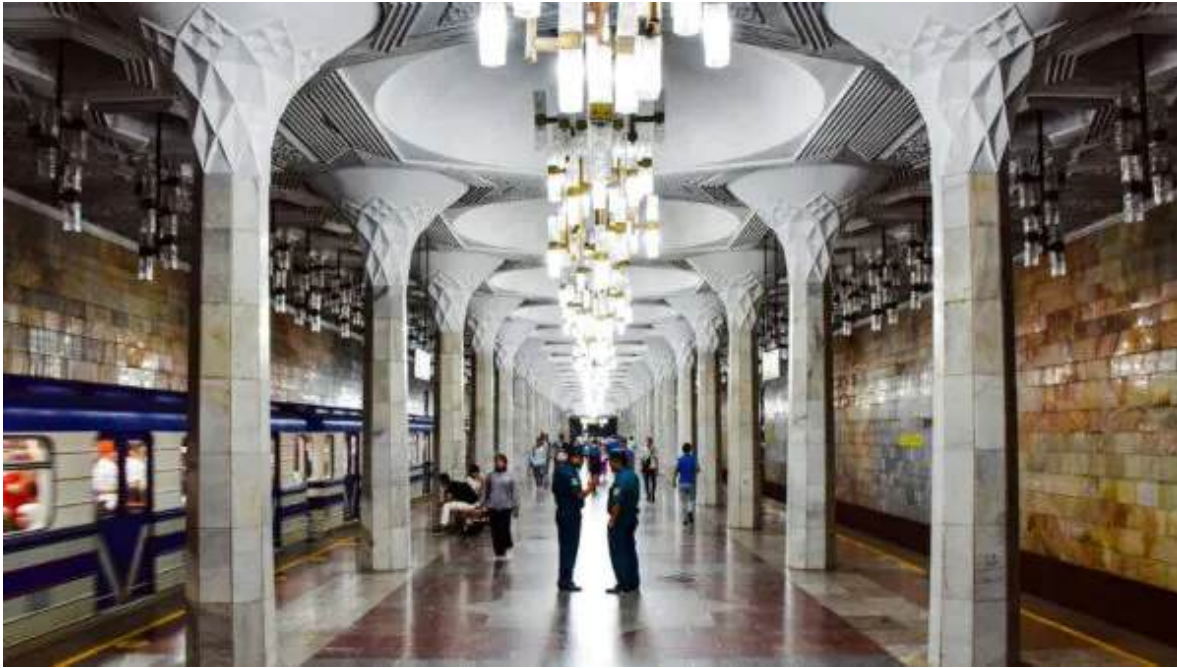
Metro de Tashkent.

Desayuno y tour panorámico por la parte moderna de la capital de Uzbekistán. Recorreremos la Plaza de la Independencia y la Eternidad, las fuentes de la ciudad y los monumentos más modernos, la Plaza de Amir Temur, la Plaza de la Opera y el Ballet, el majestuoso metro de la ciudad, y el Museo de Artes Aplicadas.. Almuerzo en un restaurante local y traslado al hotel. Tarde libre para pasear por la ciudad por tu cuenta. Cena libre y noche en Tashkent.