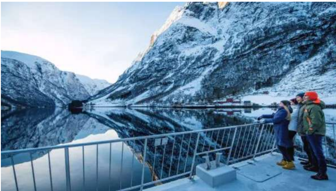
Creuer pels Fiords.

Esmorzar. Avui realitzaràs l'excursió Norway in a Nutshell, que et portarà d'Oslo a Bergen. L'excursió comença a l'estació d'Oslo, on agafareu el tren exprés amb sortida a les 08:25h. El recorregut és de gran bellesa creuant boscos, pobles i muntanyes en la seva ascensió fins a Myrdal (867 m). Allà pujaràs al famós Tren de Flam que, en molt pocs quilòmetres, baixa de forma espectacular passant per cascades i àmplies valls fins arribar a Flam, a la vora del Sognefjord. Des de Flam, realitzaràs un creuer espectacular pel Naerofjord fins a Gudvangen, on un autobús us portarà per una esgarrifosa carretera de muntanya fins a Voss. Allí connectaràs amb el tren exprés a Bergen (arribada aprox. 20:40h). Check-in al Thon Hotel Orion o similar i nit a Bergen. **Si no voleu portar la maleta d'Oslo a Bergen (i d'un transport a l'altre) podeu enviar-la opcionalment d'un hotel a un altre (el preu és de 400NOK, aprox. 35 Euros, per maleta).