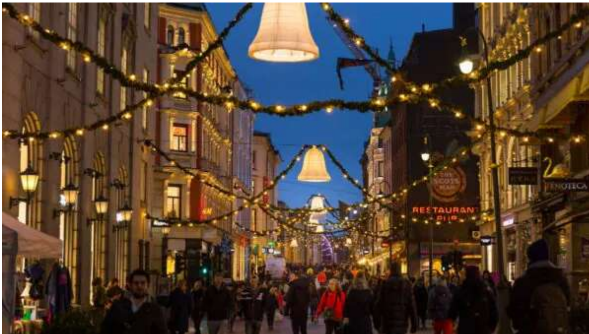
Llums nadalenques a Olo.

Presentació al vostre aeroport d'origen dues hores abans de l'hora prevista del vostre vol a Oslo. Tràmits de facturació i embarcament en vol amb destinació Noruega. El vol de Madrid té prevista la sortida a les 20:00 h, arribant a Oslo a les 23:45 h. En arribar, check-in al Thon Hotel Astoria o similar, al centre de la capital de Noruega ia prop del tren que porta a l'aeroport. Nit a Oslo.