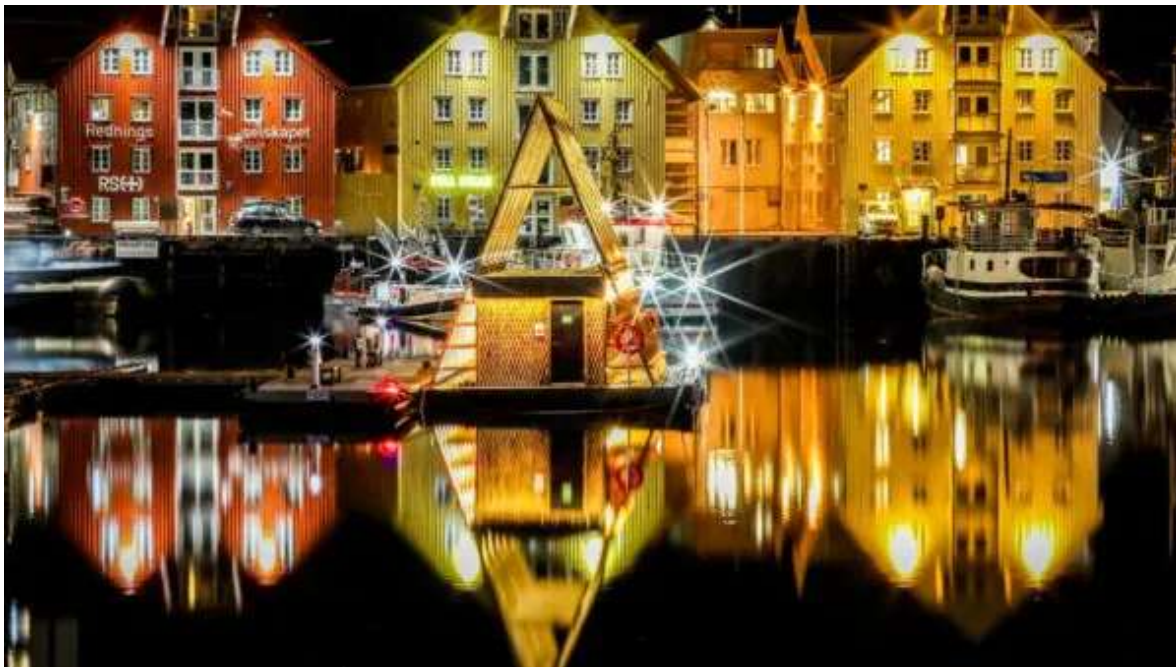
Port de Tromsø.

A l'hora indicada, tràmits de facturació a l'aeroport de Bergen i embarcament en vol amb destinació a Tromsø, a la Lapònia Noruega. La sortida està prevista a les 07:50h, aterrant a Tromsø a les 09:50h. Check-in a l' Hotel Thon Polar o similar de Tromsø i dedica la resta del dia a començar a visitar la ciutat. Destaca especialment Polària un museu i aquari dedicat a la vida a l'àrtic, molt entretingut i didàctic. Al seu costat el M / S Polstejerna és un vaixell caça-foques històric. A Tromsø hi ha dos museus molt il·lustratius, el de la Universitat (per conèixer més sobre la cultura Sámi) i l'extraordinari Museu Polar, de visita obligada, sobre la conquesta del Pol Nord per part de Nansen i Amundsen. A més dels museus i l'arquitectura, una visita obligada a Tromsø és la Mac Brewery, la fàbrica de cervesa situada més al nord del món. Nit a Tromsø.