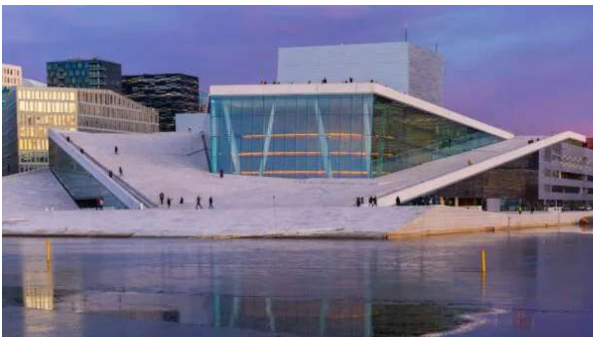
Òpera Nacional d'Oslo.

Esmorzar. Avui disposes del dia complet per gaudir d'Oslo, la capital de Noruega. Abriga't i comença el dia amb una passejada pel Parc Vigeland per admirar les seves escultures úniques.