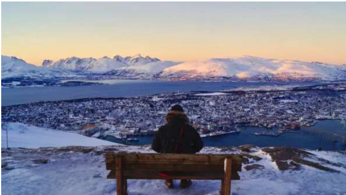
Vista Panoràmica de Tromso a l'hivern

Esmorzar i últimes hores a Noruega. Tràmits de facturació a l'aeroport de Tromso per agafar el vol domèstic amb sortida a les 11:55 hi arribada a Oslo a les 13:55 h, on connectaran amb el vol a Madrid, previst per a les 15:25 hi arribada a les 19: 10h. Arribada i final del viatge i dels nostres serveis.