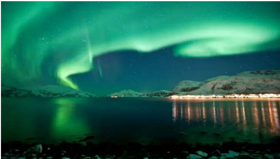
Aurores a Kvaløya.

Esmorzar i demà a la teva disposició per visitar Tromsø. La capital del nord de Noruega ocupa un emplaçament privilegiat al costat del mar i envoltada de muntanyes nevades. Tot i estar més de 300 km. per sobre del Cercle Polar Àrtic, Tromsø té un clima només moderadament fred gràcies al corrent del Golf. Un consell per a aquest matí és aprofitar quan hi hagi llum per pujar en telefèric al cim de Fjellheisen i gaudir de vistes espectaculars des de més de 400 metres de desnivell. Passegeu pel centre amb les seves cases de fusta i les seves dues catedrals del segle XIX (ambdues presumeixen de ser la seu episcopal més al nord del món). I, per descomptat, visiteu la més moderna “Catedral Àrtica” el símbol arquitectònic de Tromsø. Avui recomanem fer una bona migdiada, doncs tocarà anar a dormir tard aquesta nit. Pels volts de les 18h comença l'excursió a la recerca de les Aurores Boreals (durada aproximada 6-7 hores). L'autocar us portarà lluny de la ciutat i de tota contaminació lumínica, allà on els experimentats guies que us acompanyaran vegin que hi haurà el cel més clar i amb més probabilitats de gaudir de l'espectacle. Un cop localitzat el punt òptim per a l'observació, podreu prendre una beguda calenta amb galetes mentre espereu l'arribada de les Llums de el Nord. Els guies faran fotos de les Aurores, i us donaran algun consell perquè pugueu treure més profit a les vostres càmeres. De matinada tornada a Tromsø i nit a l'hotel.