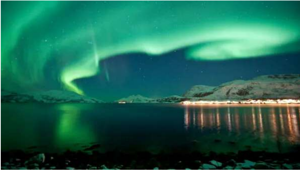
Auroras en Kvaløya.

Desayuno y mañana a tu disposición para visitar Tromso. La capital del norte de Noruega ocupa un emplazamiento espléndido, junto al mar y rodeada de montañas nevadas. A pesar de estar más de 300 Km. por encima del Círculo Polar Ártico, Tromso tiene un clima sólo moderadamente frío gracias a la corriente del Golfo. Un consejo para esta mañana es aprovechar cuando haya luz para subir en teleférico a la cima de Fjellheisen y disfrutar de vistas espectaculares desde más de 400 metros de desnivel. Pasea por el centro con sus casas de madera y sus dos catedrales del siglo XIX (ambas presumen ser la sede episcopal más al norte del mundo). Y, por supuesto, visita la más moderna «Catedral Ártica» el símbolo arquitectónico de Tromso. Hoy recomendamos hacer una buena siesta, pues tocará ir a dormir tarde esta noche. Alrededor de las 18h empieza la excursión en busca de las Auroras Boreales (duración aproximada 6-7 horas). El autocar te llevará lejos de la ciudad y de toda contaminación lumínica, allí donde los experimentados guías que te acompañarán vean que estará el cielo más despejado y con mayores probabilidades de disfrutar del espectáculo. Una vez localizado el punto óptimo para la observación, podrás tomarte una bebida caliente con galletas mientras esperas la llegada de las Luces del Norte. Los guías tomarán fotos de las Auroras, y os darán algún consejo para que podáis sacar mayor provecho a vuestras cámaras. Regreso de madrugada y noche en Tromso.