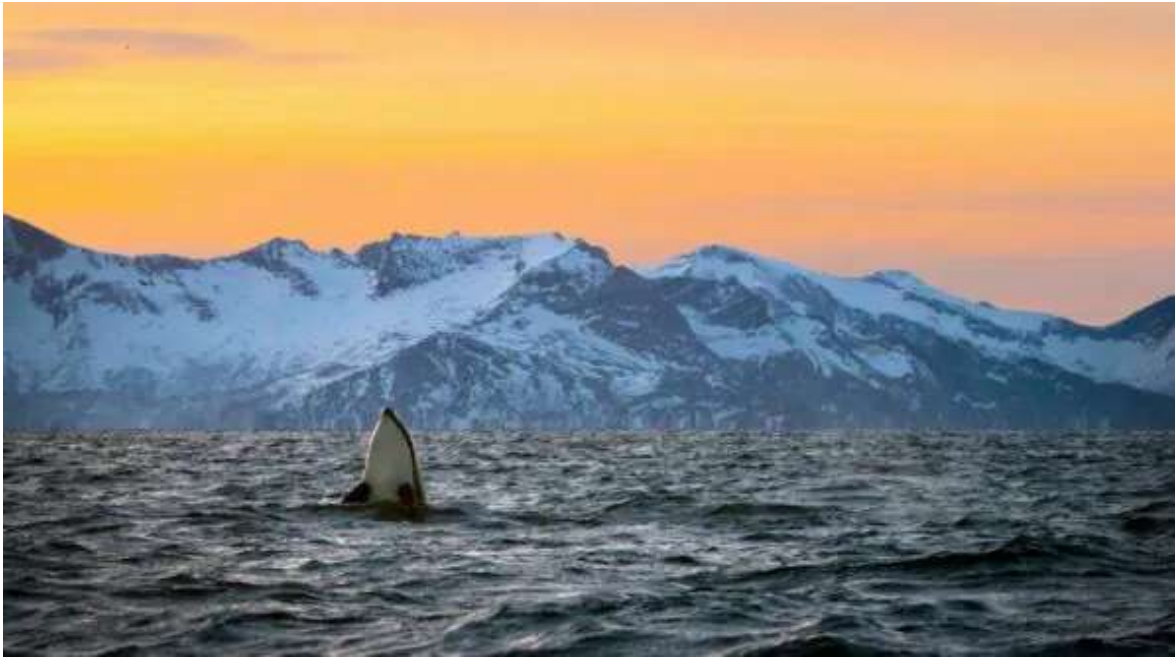
Ballena en los Fiordos de Tromso

Desayuno. Hoy dispones del día completo para continuar visitando la ciudad y sus espectaculares alrededores árticos. Para ello puedes hacer alguna actividad opcional, como por ejemplo: