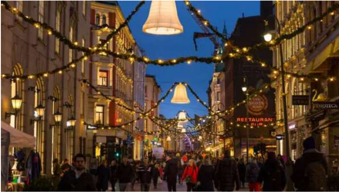
Luces Navideñas en Olo.

Presentación en tu aeropuerto de origen dos horas antes de la hora prevista de tu vuelo a Oslo. Trámites de facturación y embarque en vuelo destino Noruega. El vuelo de Madrid tiene prevista la salida a las 20:00h, llegando a Oslo a las 23:45h. A la llegada, check-in en el Thon Hotel Astoria o similar, en el centro de la capital de Noruega y cerca del tren que lleva al aeropuerto. Noche en Oslo.