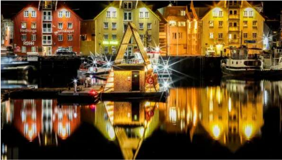
Puerto de Tromsø.

A la hora indicada, trámites de facturación en el aeropuerto de Bergen y embarque en vuelo destino a Tromsø, en la Laponia Noruega. La salida está prevista a las 07:50h, aterrizando en Tromsø a las 09:50h. Check-in en el Hotel Thon Polar o similar de Tromsø y dedica el resto del día a empezar a visitar la ciudad. Destaca especialmente «Polaria» un museo y acuario dedicado a la vida en el ártico, muy entretenido y didáctico. A su lado el M/S Polstejerna es un barco cazafocas histórico. En Tromsø hay dos museos muy ilustrativos, el de la Universidad (para conocer más sobre la cultura Sámi) y el extraordinario Museo Polar, de visita obligada, sobre la conquista del Polo Norte por parte de Nansen y Amundsen. Además de los museos y la arquitectura, una visita obligada en Tromsø es la «Mack Brewery», la fábrica de cerveza situada más al norte del mundo. Noche en Tromsø.