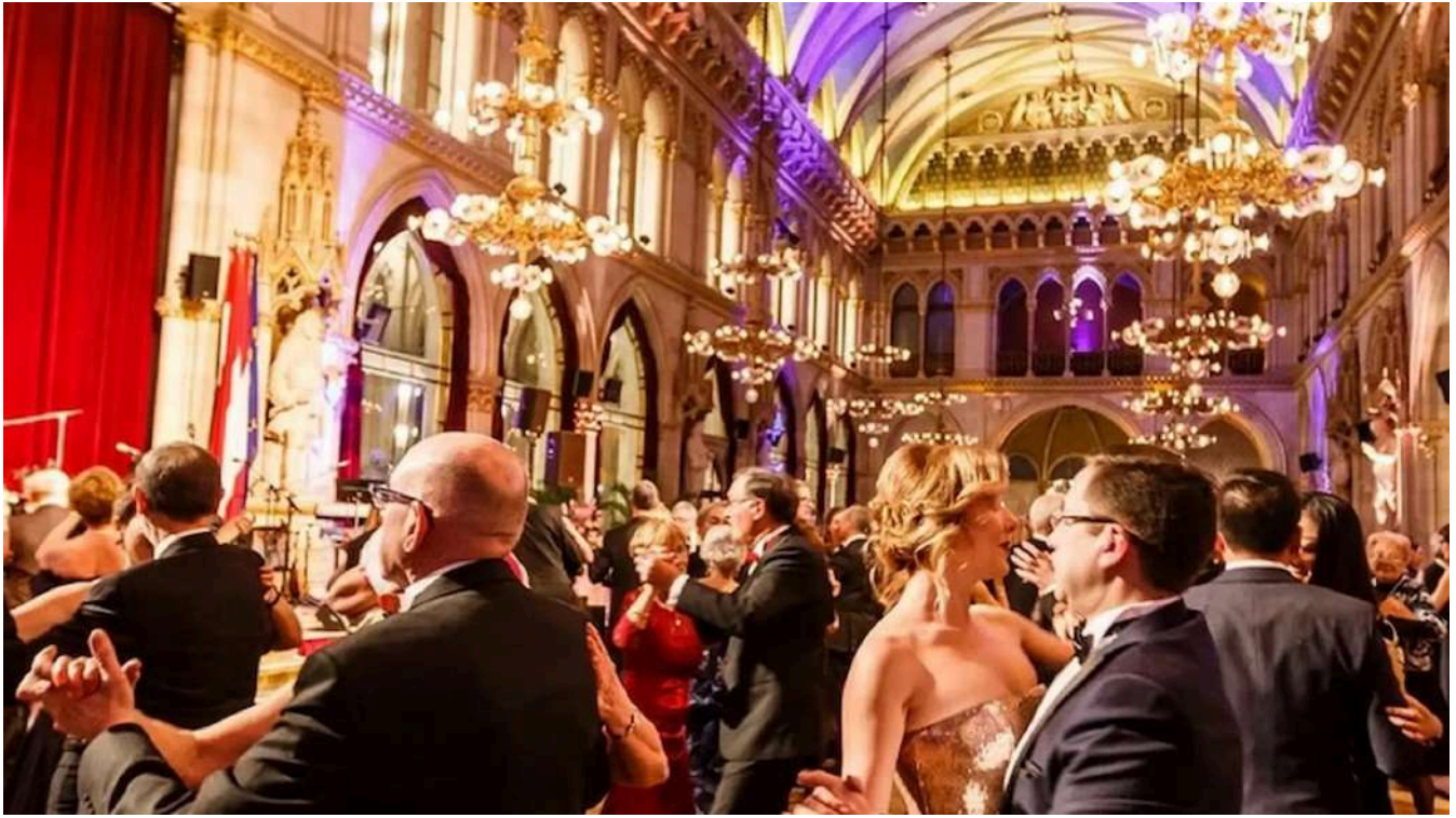
Vals de Medianoche en el Ayuntamiento de Viena