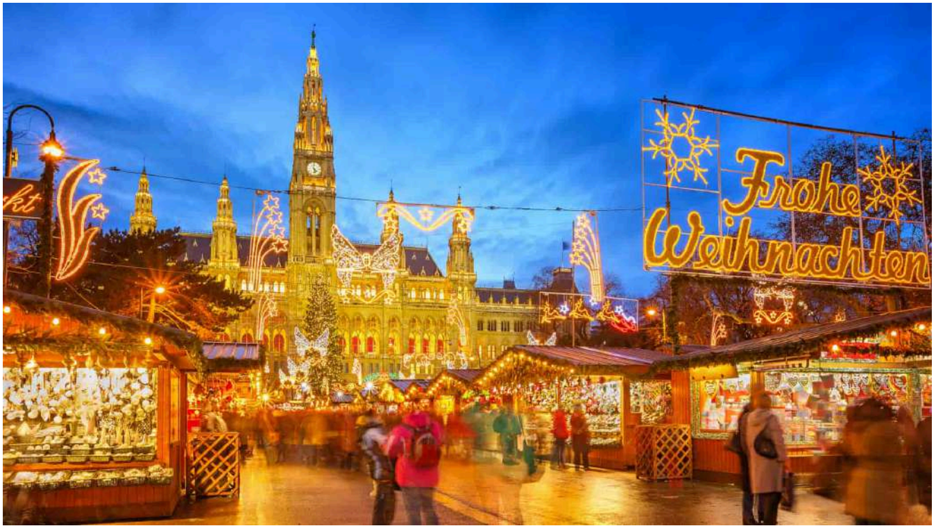
Mercadillo de Navidad Viena

Desayuno. Empieza en el Hofburg, el Palacio Imperial, donde podrás explorar los Apartamentos Imperiales y el Museo de Sissi. Luego, dirígete a la Catedral de San Esteban, el corazón gótico de Viena, para disfrutar de las vistas desde su torre. Almuerza en el Plachutta, uno de los mejores lugares para probar el tradicional Tafelspitz , una carne hervida que es toda una institución en Viena. Por la tarde, pasea por la Ringstrasse, una avenida que rodea el centro de la ciudad y donde podrás admirar edificios emblemáticos como la Ópera de Viena y el Ayuntamiento. Si te gusta la música clásica, termina el día con un concierto en la Ópera Estatal o en la Sala Dorada del Musikverein, sede de la Filarmónica de Viena. Para cenar, una buena recomendación es Figlmüller, conocido por servir el mejor Wiener Schnitzel de la ciudad.