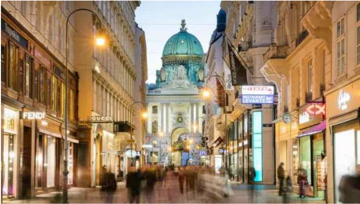
Kohlmarkt en Viena

Presentación en tu aeropuerto de origen dos horas antes de la salida prevista del vuelo a Austria. El vuelo de Madrid sale a las 08:40h y tiene la llegada prevista a Viena a las 11:40h. El de Barcelona tiene salida prevista a las 10:05h. y con llegada a Viena a las 12:20h. Trámites de facturación y embarque destino Viena. A la llegada, recogida del equipaje y traslado incluido con el tren rápido «City Airport Train» o con el «Rail Jet» hasta el centro de la ciudad. Check-in en el Hotel Elaya City West 4* o en el Hotel MOOONS 4*Sup en Viena. Dispones del resto del día para empezar a descubrir la espectacular belleza imperial de Viena. Te recomendamos pasear por su elegante casco antiguo y dejarte llevar por el ambiente de la ciudad. La ciudad está especialmente bonita por estas fechas con todas las iluminaciones navideñas. Además, podrás visitar algunos de los mercados navideños que se mantienen abiertos en la ciudad hasta finales de año. Noche en Viena.