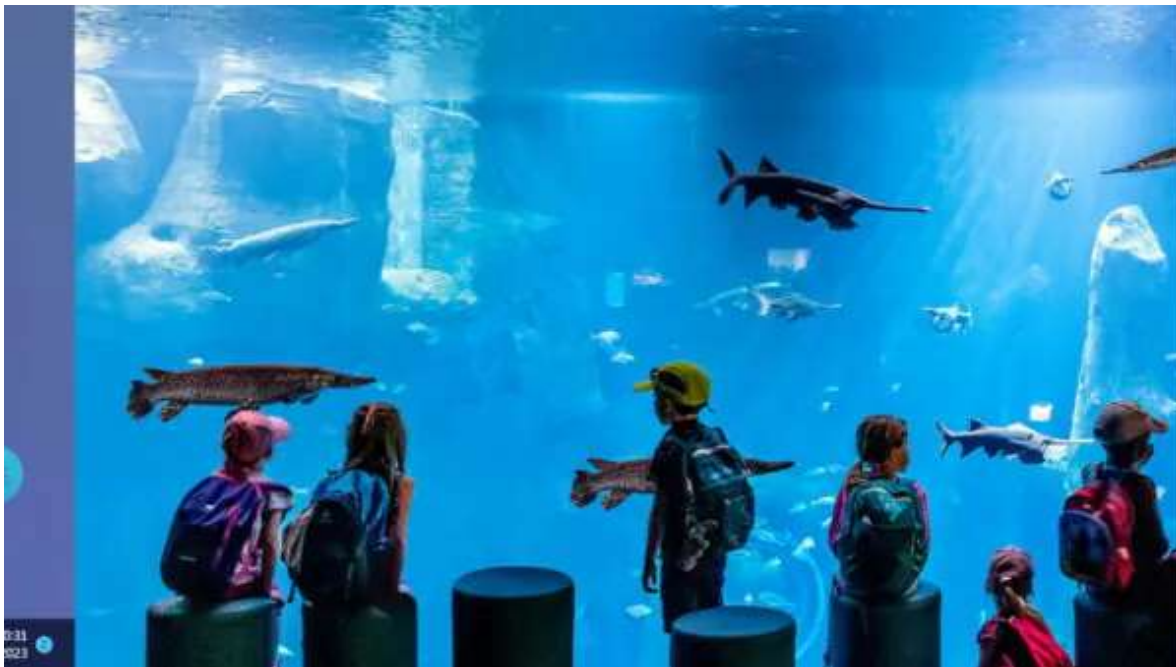
Aquari Aquatis.

Esmorzar. Com que el teu vol de tornada és a la tarda disposaràs de gran part del dia per visitar Lausanne. Just al costat de l'hotel us espera el fabulós Aquatis (entrada inclosa), un espectacular aquari i vivari amb fauna de tots els ecosistemes d'aigua dolça i és el més gran i modern del món. El nucli antic de la Ciutat, presidit per la catedral gòtica més important de Suïssa, és molt bonic i ple de llocs típics i museus de gran qualitat. Lausanne és la capital mundial de l'olimpisme, ja que la seu del COI es troba al preciós barri d'Ouchy, al costat del llac. Agafa el metro que us portarà còmodament de l'hotel a la vora del Llac Léman. Aquí podeu visitar el Museu Olímpic, que retrata tota la història de l'esport i és molt modern i amè. La visita és totalment interactiva, de manera que tant els nens com els adults ho passaran d'allò més bé durant la visita. A una hora prudencial, agafa el tren que et portarà de Lausanne a l'aeroport en uns 50 minuts. Tràmits de facturació i embarcament en vol de tornada. Arribada i final del viatge i dels nostres serveis.