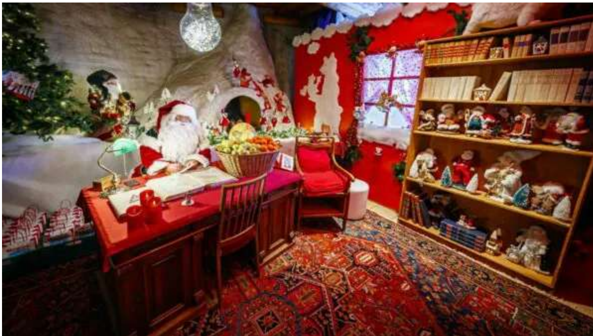
Pare Noel a Rochers de Naye.